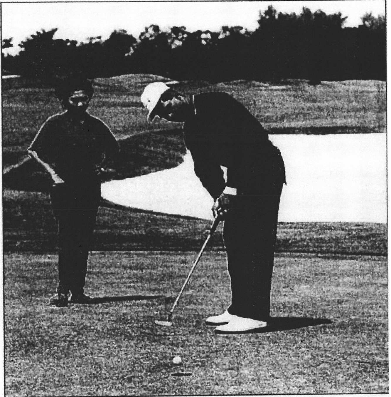
Hanya sebagai riadah: Sheik mempunyai handikap 18 dalam golf.